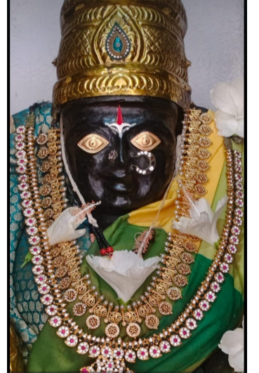
మే 11-04-2025 వరకు ఈ రోజున దనశక్తి దేవాలయం లో కుంకుమ పూజలు జరుగును. మాతలు ఎక్కువ సంఖ్యలో పాల్గొని విజయవంతం చేయగలరు.

ఈ సంవత్సరము రెండవ శుక్రవారం రోజున శ్రీ సూర్య ధన్వంతరి దేవాలయం నందు వెలసి యున్న మాతా ధన లక్ష్మిదేవి సేవలో శ్రీ ధన్వంత్రీ సేవా సమితి వారి అధ్యక్షులలో కుంకుమార్జన మరయు లలితా సహస్ర నామాల స్తోత్ర పారాయణం చేసారు. మాతలు అధిక సంఖ్యలో పాల్గొని అమ్మ వారికి ఒడి బియ్యం సమ ర్థం చారు కుంకుమ పూజ అనంతరం లక్ష్మీ దేవీ ధార ఒక్కొక్కసారి చేసి వారికి అమ్మ వారి శేష వస్త్రంతో ఆలయ పూజా ఆధ్వర్యంలో ఆశీర్వచనములతో సత్కరించడము జరిగింది. ప్రతి శుక్రవారం అమ్మవారి ప్రసాదంగా మాతలకు సమర్పించ బడును. ఈ విధంగా ప్రతి శుక్రవారం రోజు సూర్య ధన్వంతరి దేవాలయములో కుంకుమ పూజలు జరుగు చుండును. దీనికి ఎలాంటి రుసుము లేదు. కావలసిన పూజ సామాగ్రి దేవస్థానం వారు సమకూర్చ గలరు. మరియు రవాణా సౌకర్యం కలదు. అధిక సంఖ్యలో భక్తులు మహిళా మణులు పాల్గొని కార్యక్రమం విజయవంతం చేయ గలరు. ఈ కార్యక్రమము నందు దేవాలయ త్రస్ట్ ఫౌండర్ 60% చైర్మన్.